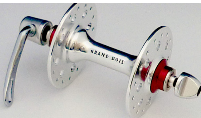
GrandBois Large Flange Hubs for 11 speeds Front and Rear set 22,500JPY